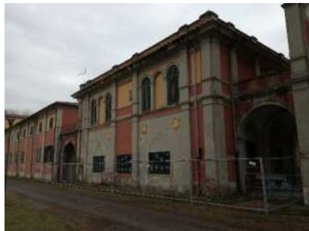
Vista edificio 2 ad ovest Arcone (lato frontale e tergale)