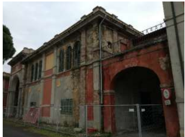
Vista edificio 1 ad est Arcone (lato frontale e tergale)